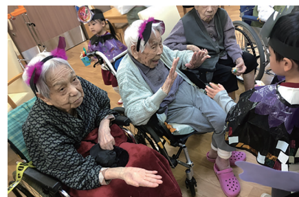
季節に合わせたさまざまな行事を実施。また隣接する「種田こども園」の子どもたちとふれあうイベントもあり、子どもたちと楽しい時間を過ごしている。